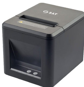
Impresora Térmica SAT Q22