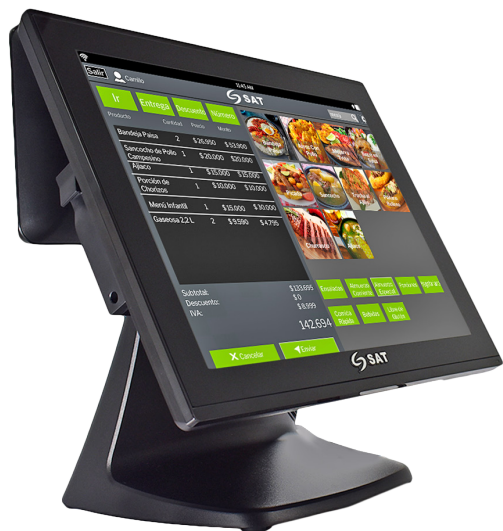
EQUIPO AIO SAT CI150