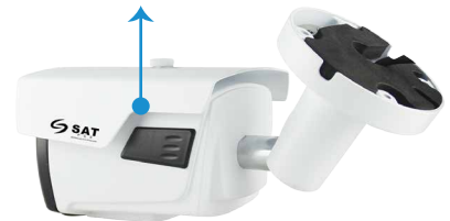
Cámara tipo Bullet